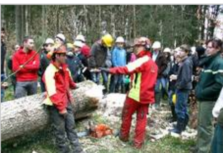
Démonstration de bûcheronnage au Ronzet.

Aussi, au début du mois d'avril, une journée de présentation