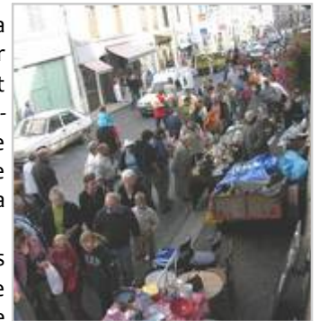
Eviter la cohabitation dangereuse entre les piétons et les automobilistes est la priorité pour la foire du 9 août.

(les exposants étant toujours placés le long du mur) afin de maintenir le trafic routier dans les deux sens sans risque pour les chalands. L'avenue de la Gare, du restaurant Robert au sommet du Foirail sera par contre totalement interdite à toute circulation (sauf secours). Un panneautage sera mis en place la veille. Route de Flayat, un stationnement unilatéral sera aussi expérimenté pour éviter les bouchons habituels du matin.